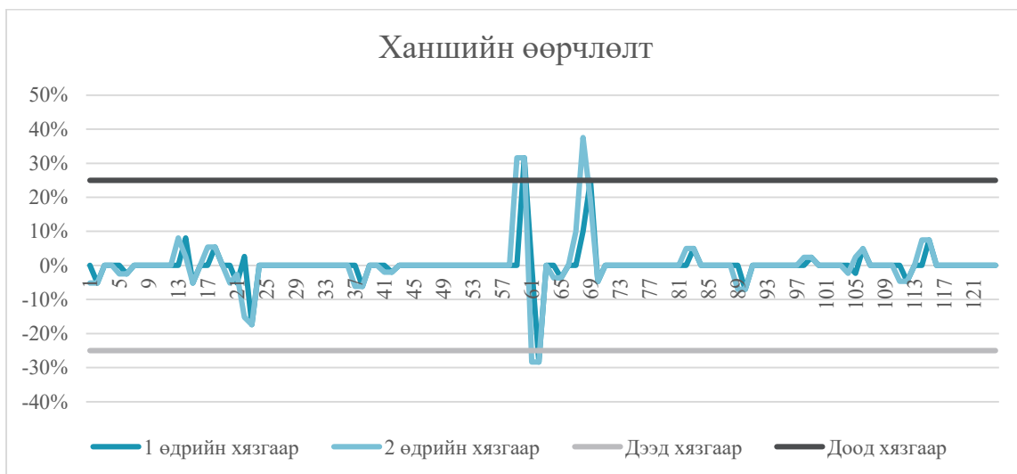
График 2. Ханшийн өөрчлөлт, 2019 оны эхний хагас жил

Дээрх графикаас харахад нэг болон хоёр өдрийн дотор ханш 25%-аас илүү өөрчлөгдсөн тохиолдол гарсан ч энэ нь дэнчингийн доод түвшинг ихэсгэхүйц нөлөө үзүүлээгүй. Тиймээс төлбөрийн одоогийн мөрдөгдөж буй дэнчингийн хувь нь эрсдэлийг хаах боломжит хэмжээнд байна гэж үзэж болно. Тус хувийг бууруулж хөрөнгө оруулагчдын урьдчилан байршуулах мөнгийг багасгах боломжтой хэдий ч, энэ нь төлбөрийн эрсдэлийг нэмэгдүүлэх сул талтай.